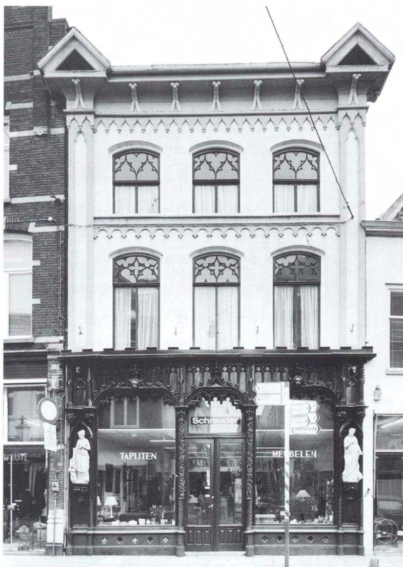
Winkelpand aan de Kerkstraat 34

en gewelven van stucwerk op latten en riet toepaste. De kroonprins en latere Koning Willem II, die in Engeland een grote liefde voor de neogotiek had opgedaan en graag in Tilburg woonde, had waarschijnlijk invloed op de stijlkeuze. Daarbij was er sprake van omvorming van de middeleeuwse gotiek naar een neogotisch, typisch negentiende-eeuws ideaal.