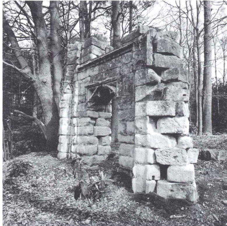
De kunstmatige ruïne uit 1902-1903 op het Landgoed Sparrendaal te Vught

Rond 1800 drong vanuit Engeland en Duitsland ook in Nederland de voorliefde voor de gotische bouwkunst van de Middeleeuwen door. Het ging toen nog niet om waarheidsgetrouwe navolgingen van gotische gebouwen of om het voortbouwen op middeleeuwse constructieprincipes. Integendeel: men gebruikte de middeleeuwse elementen in nieuwe gebouwen, waarbij de spitsboogvormen werden vertaald in materialen, die typerend waren voor de negentiende eeuw: pleisterwerk, terracotta, zink en gietijzer. We spreken bij deze vroege gebouwen daarom van spitsbogenstijl, ook al om ze te onderscheiden van de neogotiek, die later in de eeuw correcter en waarheidsgetrouwer te werk gaat. Adellijke heren en gegoede burgers bouwden bijvoorbeeld op hun landgoederen stenen 'follies', architectonische dwaasheden. Het waren meestal functioneel gebouwde tuintjes, die de indruk wekten dat het vervallen restanten waren van gotische kerken of eeuwenoude kastelen. Ze werden op bijzondere plekken gebouwd en verrijkten het parklandschap met verrassende doorkijkjes en hadden tot doel om de wandelaar in een melancholieke stemming terug te roepen naar oude tijden. Een goed voorbeeld van een dergelijke bouwval is de 'folly' op het landgoed Sparrendaal onder Vught, die geheel de sfeer van de landgoederen uit de periode kort na 1800 uitstraalt. In feite is het gebouwtje pas in 1902-1903 door