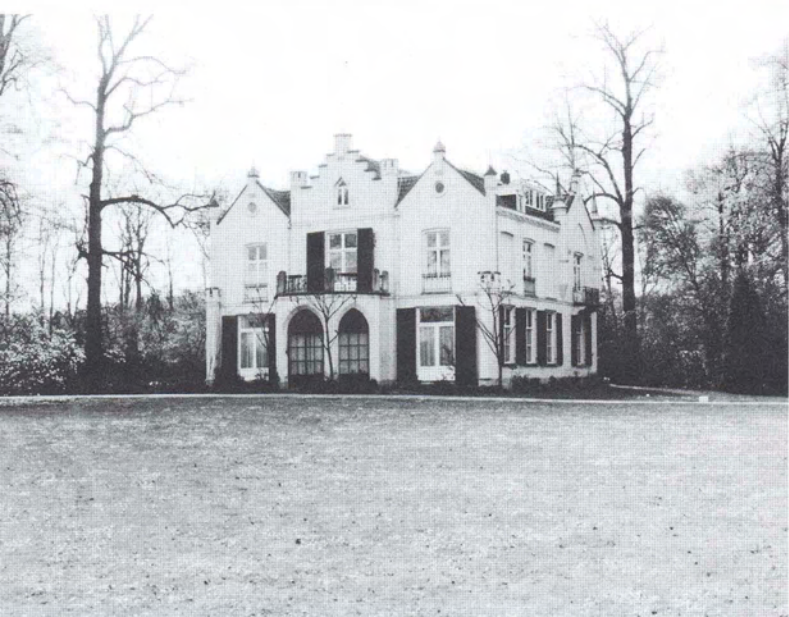
Het Vughtse huis Eikenheuvel rond 1985

De middeleeuwse vormen van die huizen gaven een beeld van een idyllische, onbedorven schijnwereld waar- aan in de negentiende eeuw, het tijdperk van industriële groei en ontwikkeling van steden, behoefte was, zelfs of juist in het bijzonder bij de industriëlen. Een markant voorbeeld van deze belangstelling voor de historie is het middeleeuwse kasteel Heeswijk. De nieuwe eigenaar, A.J.L. baron van den Bogaerde van Terbrugge, een fervent verzamelaar van oudheden, liet daar vanaf 1835 talloze antieke bouwfragmenten in metselen. In 1842 merkte een bezoeker op dat de fragmenten 'in den muur met zoveel kunstzin zijn ingemetseld, dat men in de verzoeking komt van te geloven, dat zij daarin bij het stichten der burg met verkwistende mildheid zijn gerangschikt'. Het is een opvallend verschijnsel dat die kasteelachtige huizen er eerder waren dan de kerken, die wij meestal met neogotiek of spitsbogenstijl verbinden. Tussen 1835 en 1840 verrijzen in Tilburg (Goirkekerk) en Schijndel de eerste Brabantse kerken in spitsbogenstijl. Beide gebou- wen werden ontworpen door de Oisterwijkse 'opziener van publieke werken' H. Essens, die spitsboogramen, bogen