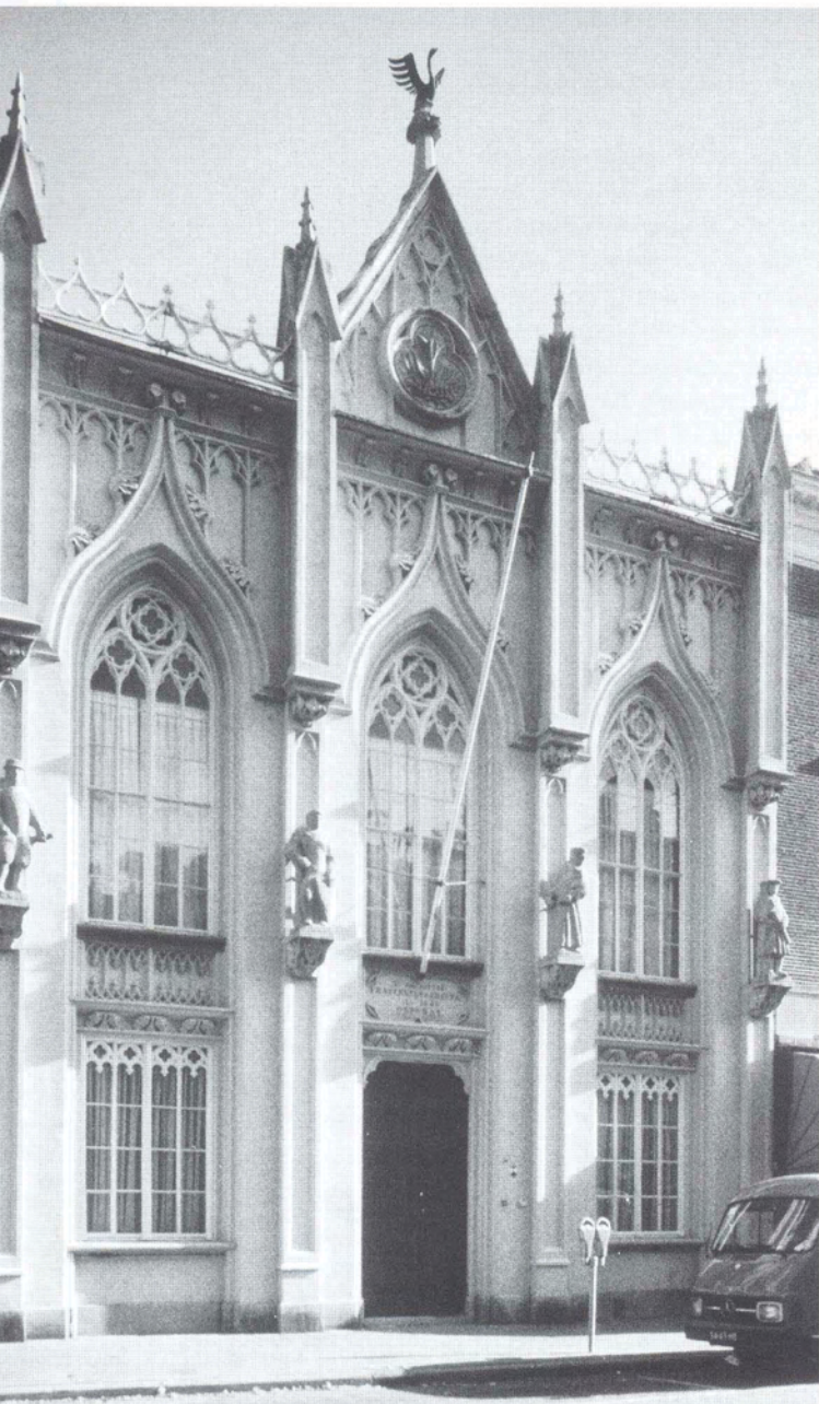
Neogotische gevel van het Zwanenbroedershuis aan de Hinthamerstraat.

tische en neogotische stijl. In 1847 bouwde hij de Waalse (thans Lutherse) kerk aan de Verwersstraat. Dit kerkgebouw, dat het smalle en diepe perceel van een stadswoonhuis vult, heeft een rijzige gevel. Deze was bekroond met twee thans verdwenen torens, die er een miniatuurkathedraal van maakten. Inwendig is de wandindeling van de met stucgewelven overdekte ruimte afgeleid van schip en dwarsschip van de Sint-Jan. De witte wanden hebben